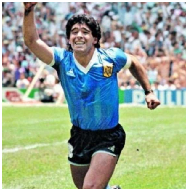
El astro del fútbol tendrá su monumento en el "campito" de la estación

cargo de artistas locales que surgirán de un curso organizado oportunamente por el Municipio.