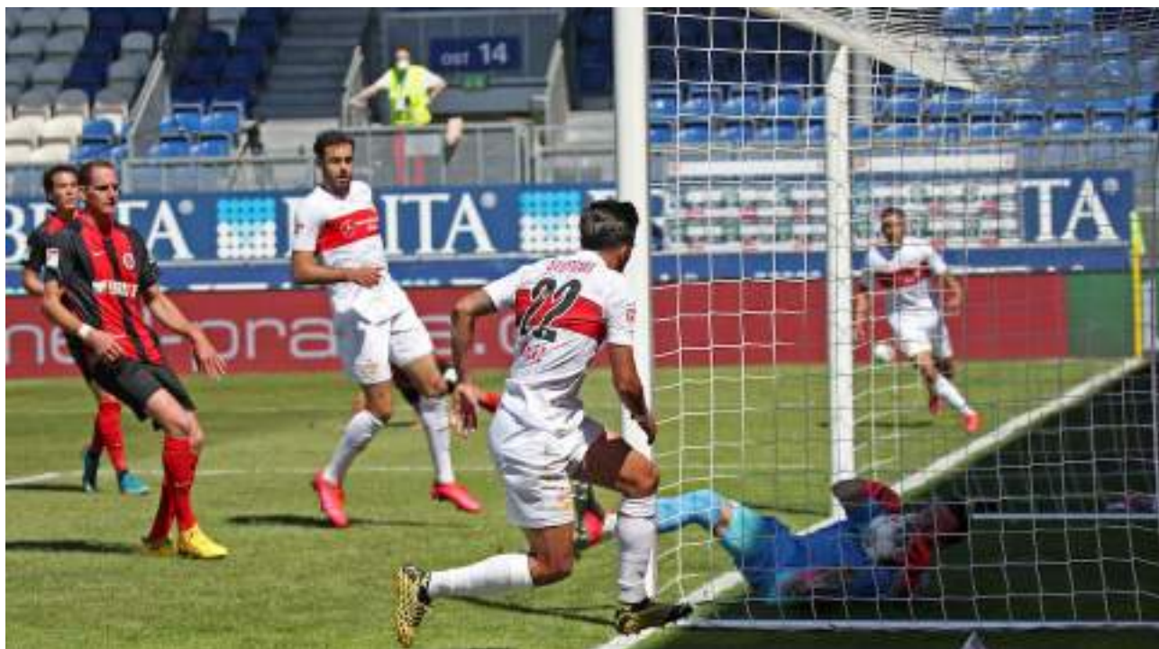
El momento del gol, la empujó de zurda tras un desborde