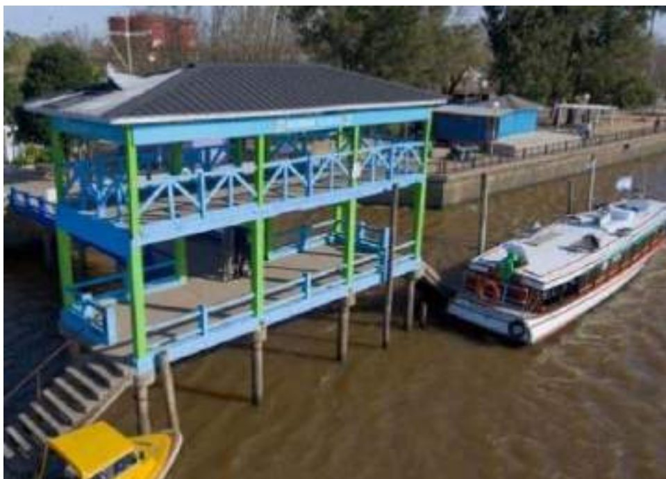
El río Paraná, lugar turístico por excelencia en Belén de Escobar

El encuentro se realizó mediante una videoconferencia, a través de una plataforma online provista por la Universidad Blas Pascal de Córdoba, donde además participaron representantes de la Organización Mundial del Turismo (OMT), de la Organización de las Naciones Unidas (ONU), de la Or-