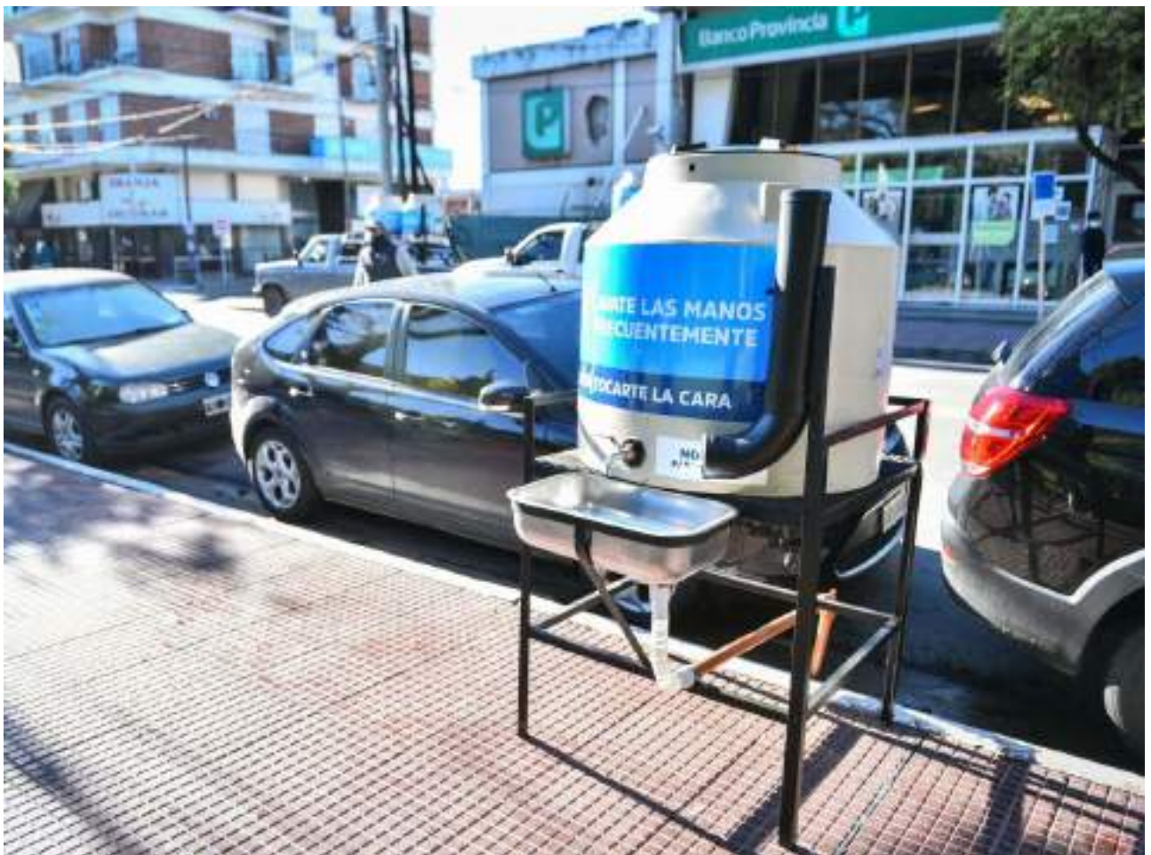
En la plaza San Martín hay uno de los tanques para aseo de manos

trabajos constantes de desinfección que se realizan diariamente en la vía pública, dependencias municipales y oficinas de atención al público, bajo los estrictos protocolos que impone el aislamiento social, preventivo y obligatorio.