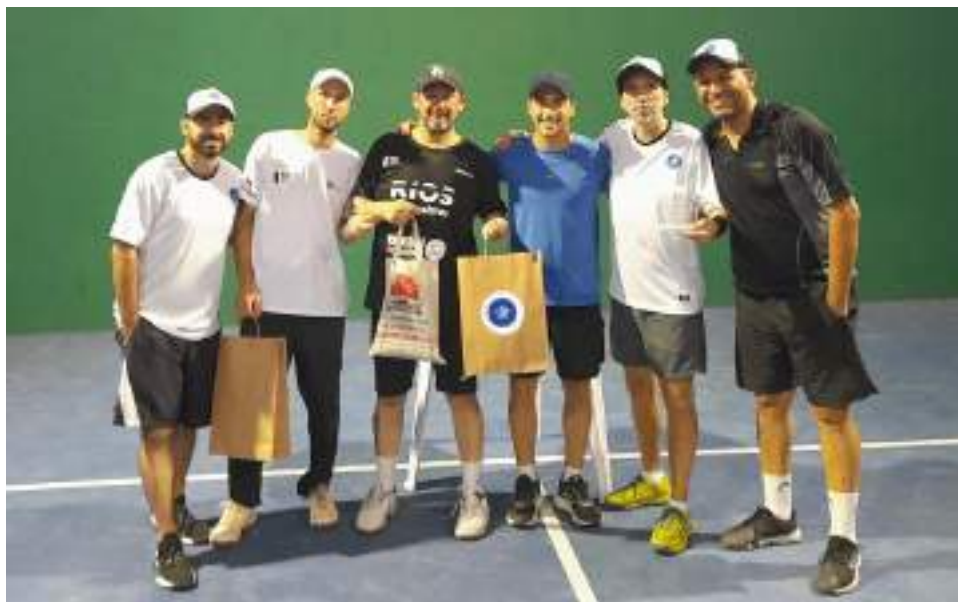
Finalistas, organizadores y sponsor, posan en el predio de Escobar

Además, ofrece clases de tenis: desde una escuela para niños (martes a las 18hs y sábados a las 9hs) hasta clases individuales para adolescentes, jóvenes y adultos.