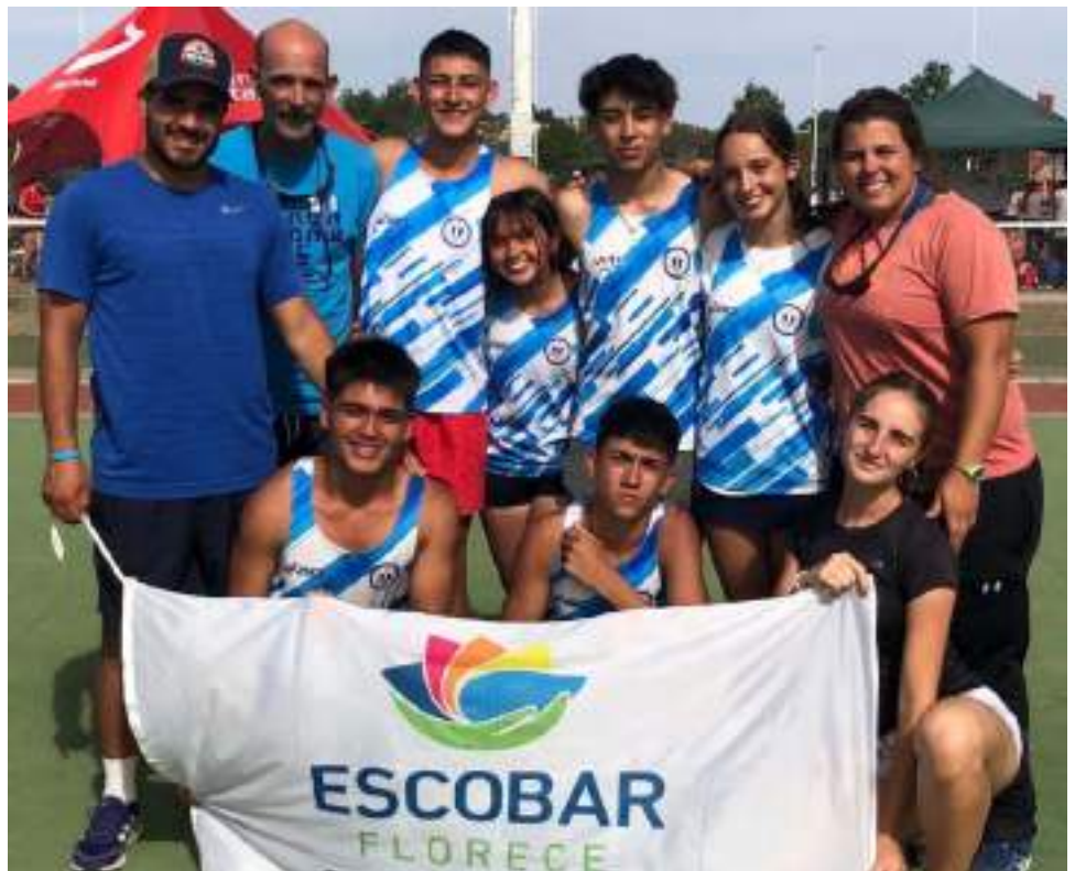
Los seis atletas en Córdoba, con sus entrenadores