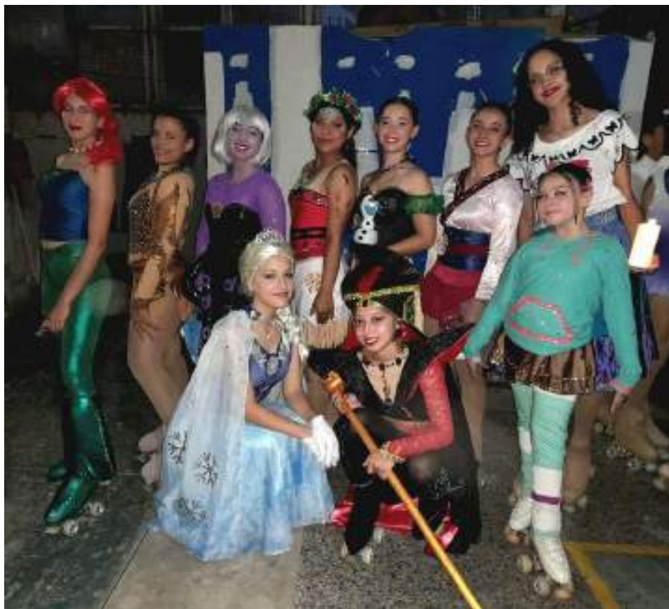
Todo el colorido, como ocurre todos los años en la fiesta de cierre