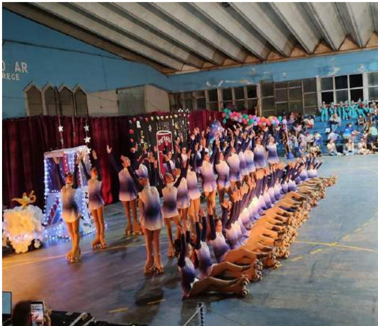
Parte de la presentación de Patines Juveniles en Escobar

1.000 personas en cada una de las dos funciones brindadas. Patines Juveniles lleva 33 años en el municipio de Escobar y cuenta con sedes en todo el partido, en los