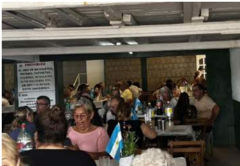
El almuerzo de fin de año reunió a 250 personas en el Paraná

nas presentes, esperándolos en los próximos eventos.