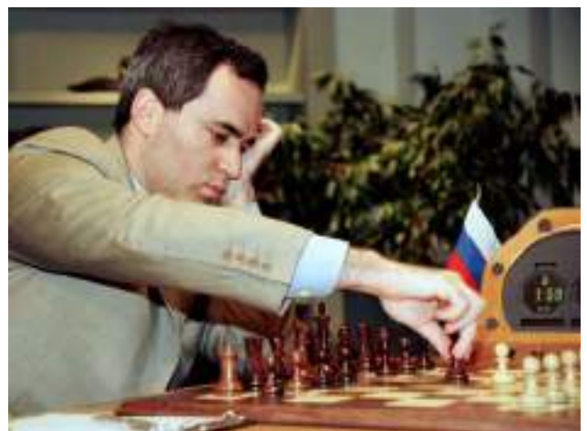
Kasparov, de los mejores ajedrecistas del mundo

Teléfonos: 0348-4440027/ 4443358/ 4449220 Mail: horaciopcampa@hotmail.com Whatsap: 11-38194923